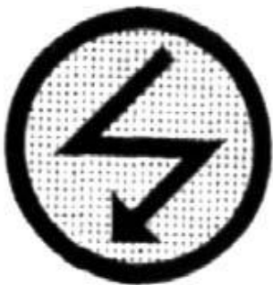
PREAVISO PUNTO DE RADIO