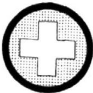
PREAVISO PUNTO DE SEGURIDAD