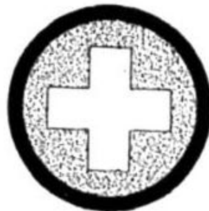
PUNTO DE SEGURIDAD